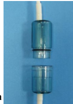
Рис. Б. Аромакапсула диффузора

Диффузор может использоваться для кислородной ароматерапии. Для этого в его устройстве предусмотрена специальная разборная аромакапсула (см. рисунок Б). При необходимости в нее можно поместить губку, пропитанную ароматической жидкостью. Это поможет сделать процедуру особенно приятной.